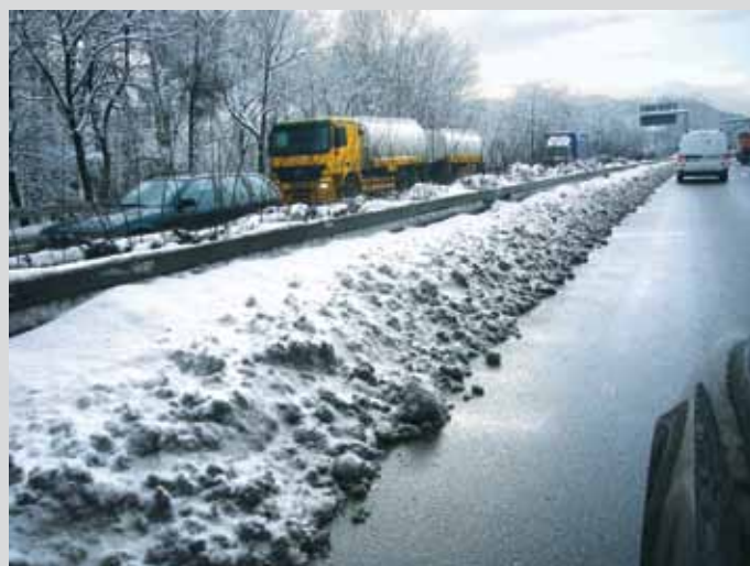
Bild 13: Schneebedeckte Stahlschutzplanke im Mittelstreifen auf der A 46