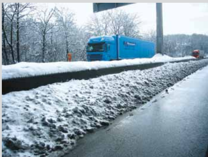
Bild 12: Schneebedeckte Betonschutzwand im Mittelstreifen auf der A 46