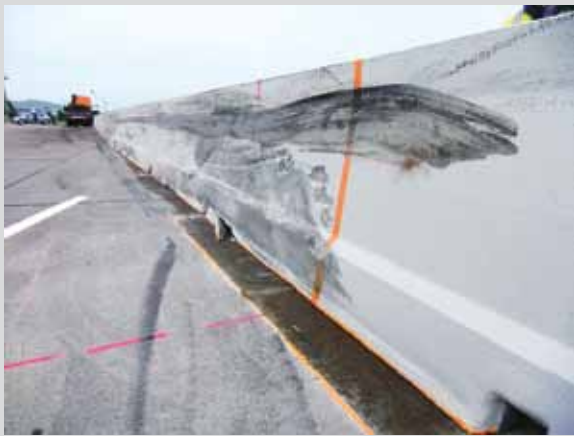
Bild 9: Geringfügige Verschiebung der Betonschutzwand mit besonders hohem Aufhaltevermögen

Sowohl an den Seitenstreifen als auch – und insbesondere – im Mittelstreifen lassen sich durch den Einsatz von Betonschutzwänden bei der Bankettpflege und beim Grünschnitt z.T. deutlich Kosten einsparen. Bedingt durch die geschlossene Bauweise sammelt sich an den Banketten kein Unrat an und die Bankette können nicht «hochwachsen», sodass ein regelmäßiger Bankettabtrag mit Entsorgung des belasteten Materials entfällt [6]. Anfallender Schmutz kann durch Abkehren einfach entfernt werden. Bei zweiseitiger Schutzeinrichtung aus Beton im Mittelstreifen ist ein Grünschnitt seltener und einfacher durchzuführen. Bei nicht bepflanzten Zwischenräumen entfällt der Grünschnitt vollständig (Bild 11).