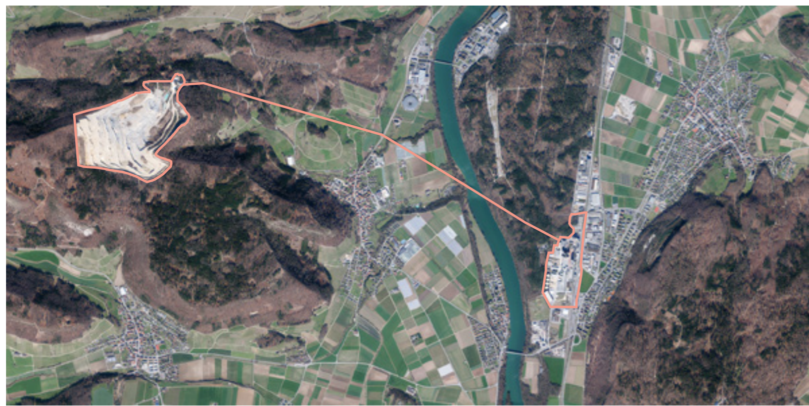
Luftbild / Vue aérienne.